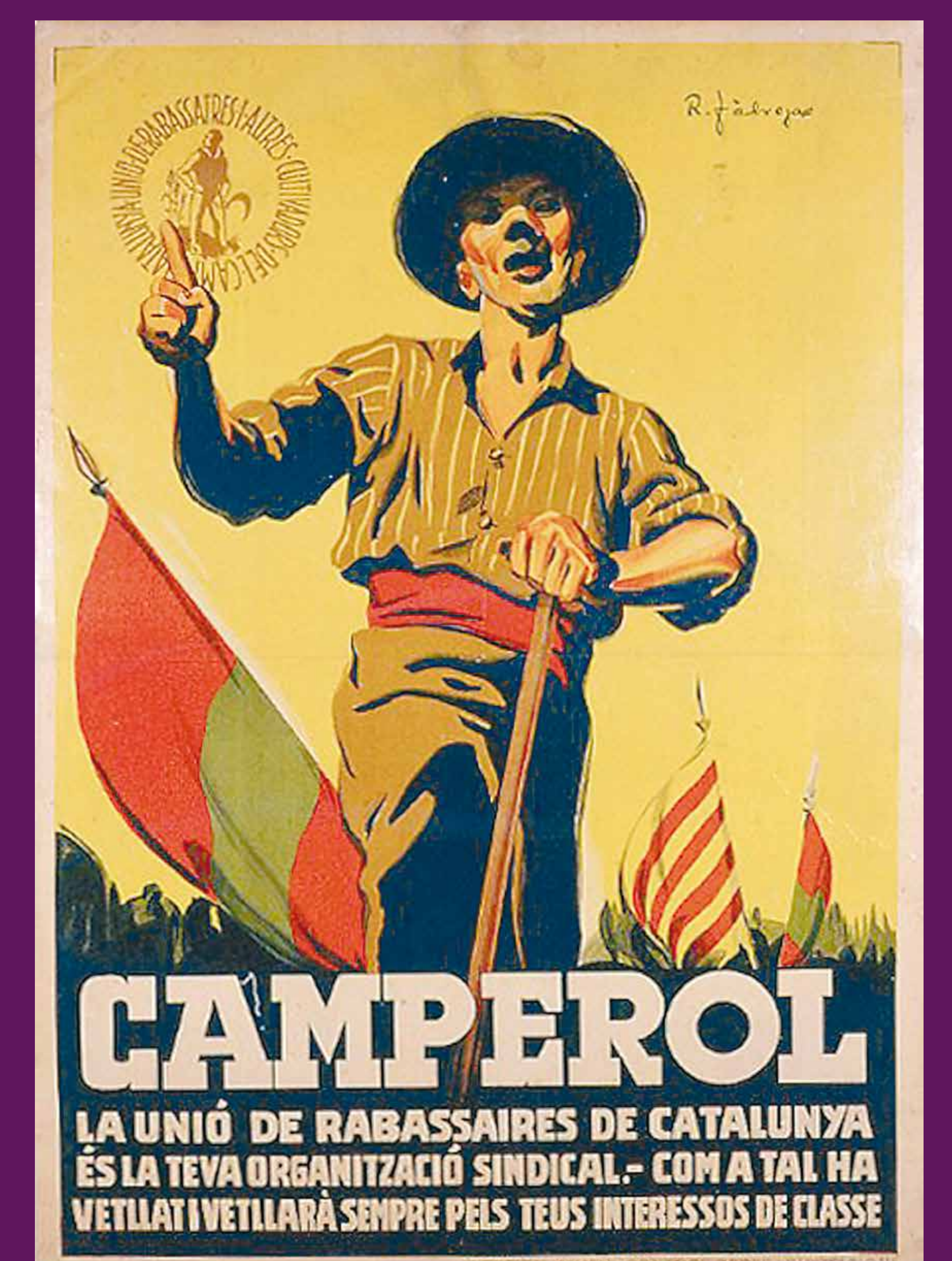
1934 Cartell de la Unió de Rabassaires, el sindicat de treballadors del camp fundat el 1922 per Lluís Companys i que fou hegemònic durant les dues següents dècades.